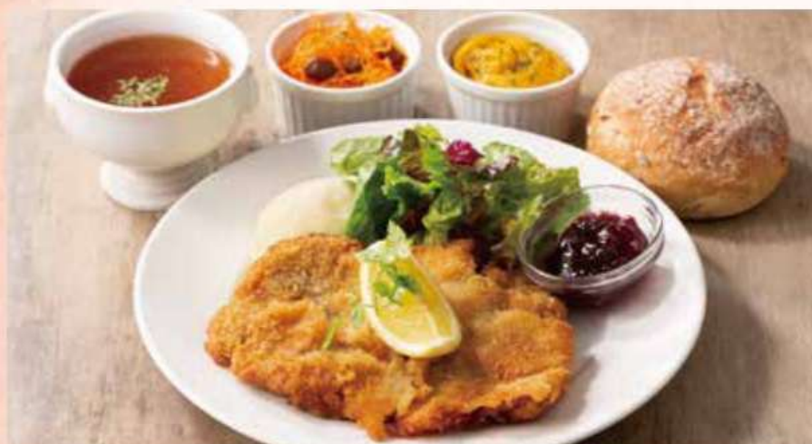
ウィナー シュニッツェル Wiener Schnitzel