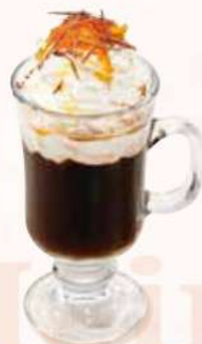
カフェ マリアテレジア Kaffee Maria Theresia