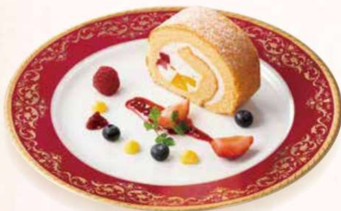
フルーツロールケーキ Obst Kuchen