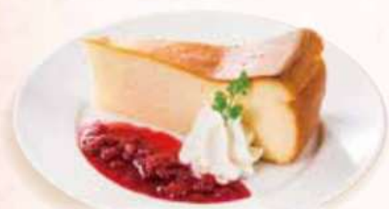
ベイクドチーズケーキ Gebackenen Käsekuchen