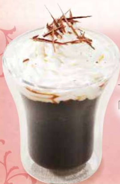
アインシュペナー Einspanner

ウィーンでは、 「Einspanner (アインシュペナー)」 “一頭引きの馬車”と呼ばれる ホイップクリームをのせた ホットコーヒー