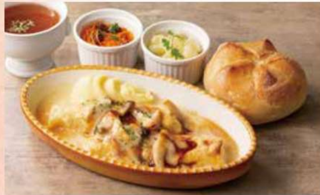
パラチンケングラタン Crepe Gratin of Leberkäse