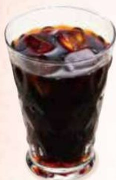
カフェ イムゾマー Sommer Kaffee