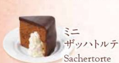
ミニ ザッハトルテ Sachertorte