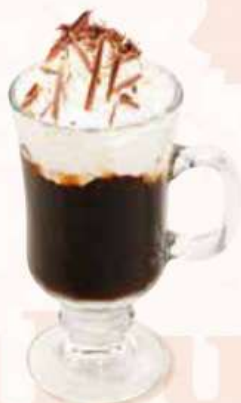
カフェ モーツァルト Kaffee Mozart