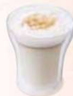
ラテ マッキヤート Latte Macchiato