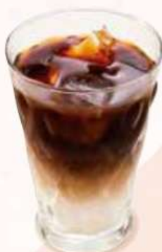
アイス・ラテ Kalte Latte