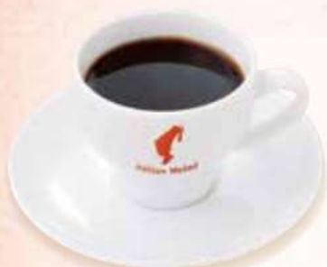
ユリウス・マイナル カフェ Kaffee