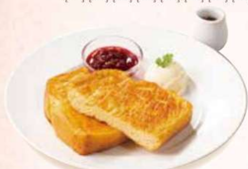
パンペルデュ リンゴンベリージャム添え