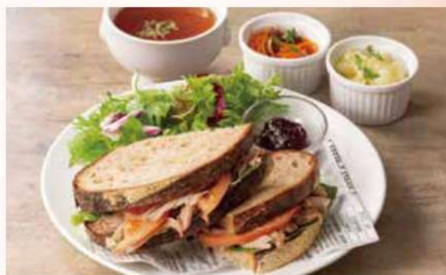
鴨のコンフィのサンドウィッチ

Sandwich of Duck Confit with Mustard Butter