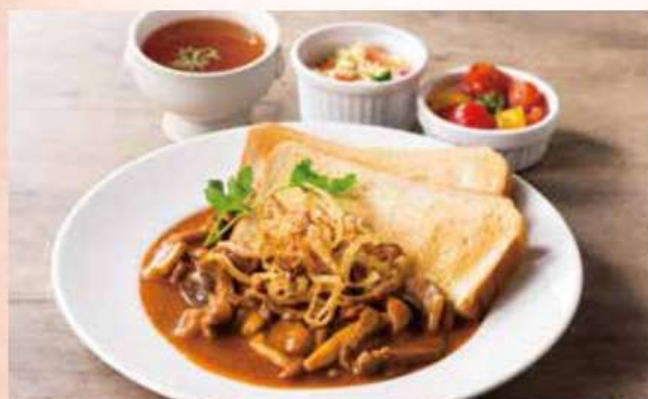
アマデューストースト