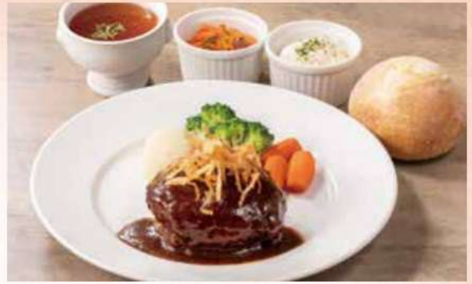
ハンバーグ Hamburger Steak