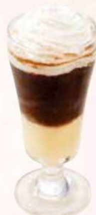
ヴィーナ アイスカフェ Wiener Eiskaffee