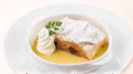
アップフェルシュトルーデル Apfelstrudel