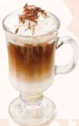
アイス フランツィスカーナー Kalte Franziskaner