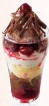
シュバルツヴァルダー