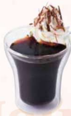
アイス アインシュペナー Kalte Einspanner