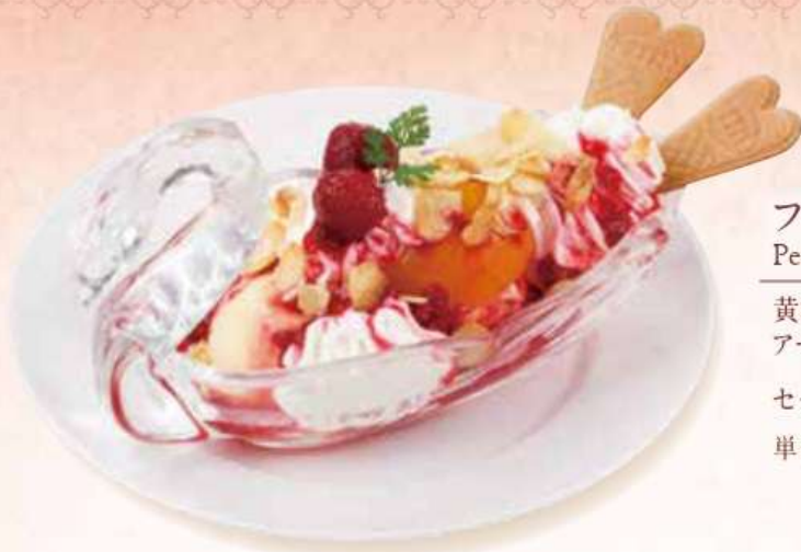
フィルシメルバ Peach Melba