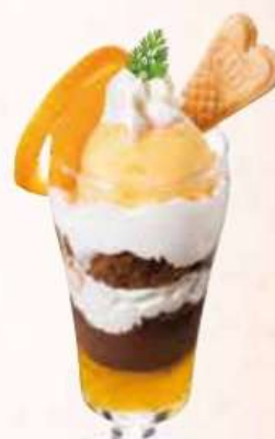
オレンジショコラーデパルフェ