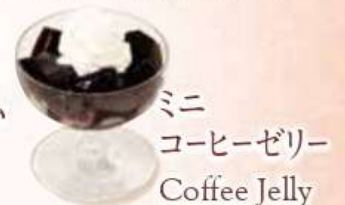
ミニ コーヒーゼリー Coffee Jelly