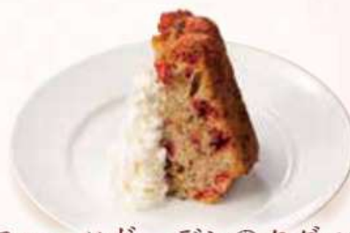
フルーツガーデンのクグロフ Gugelhupf