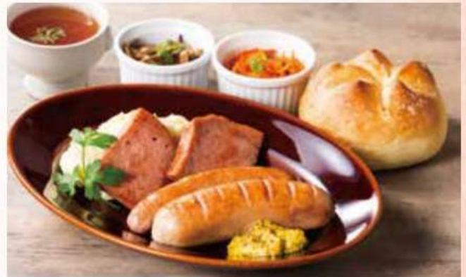
ウィーン風ソーセージのグリル Grill of Vienna Sausages