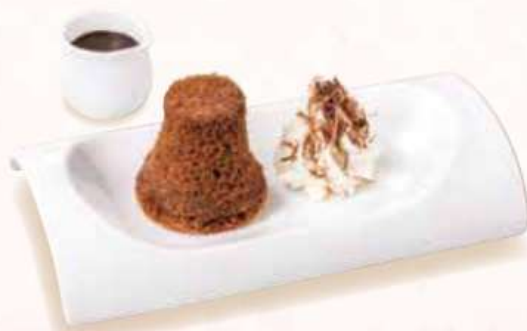
ショコラーデプディング