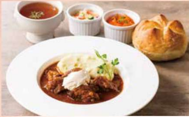
グーラッシュ Goulash of Beef