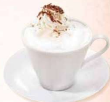
フランツィスカーナー Franziskaner