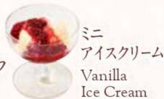
ミニ アイスクリーム Vanilla Ice Cream